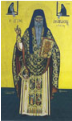
Όσιος Αθανάσιος ο Πάριος