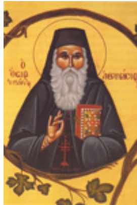
Όσιος Αθανάσιος ο Πάριος