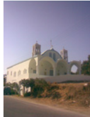
Ναός Αγίου Αθανασίου του Πάριου στο Κώστο Πάρου