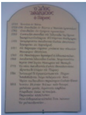
Επιγραφή στην είσοδο του Ναού με το βίο του Αγίου Αθανασίου του Πάριου