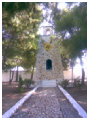
Μνημείο στο Κώστο Πάρου προς τιμή του Αγίου Αθανασίου του Πάριου