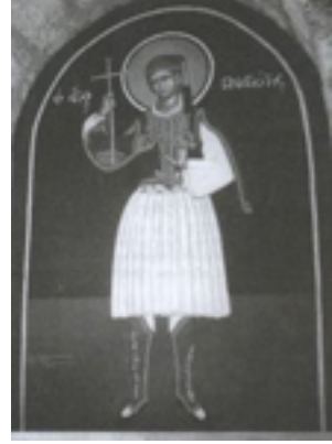
Άγιος Παναγιώτης ο Καισαρεύς