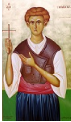
Άγιος Παναγιώτης ο Καισαρεύς - Μιχαήλ Χατζημιχαήλ© michaelhadjimichael.com