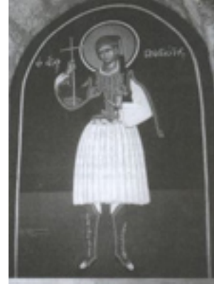
Άγιος Παναγιώτης ο Καισαρεύς