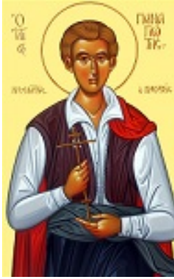
Άγιος Παναγιώτης ο Καισαρεύς - Μιχαήλ Χατζημιχαήλ