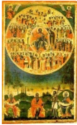
Άγιοι Πάντες - Νέα Σκήτη - Κυριακό Άγιο Όρος, 1770 μ.Χ.