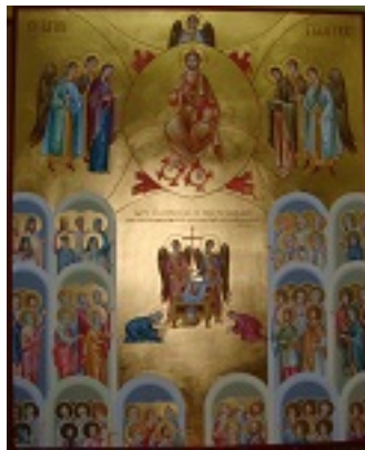
Άγιοι Πάντες - Σταύρος Τωνας© (ctonas-agiografies.blogspot.com)