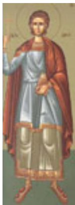
Άγιος Ιουλιανός από την Κιλικία