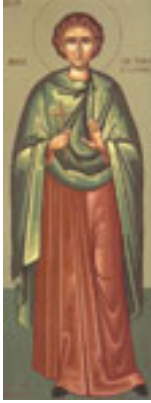
Άγιος Νικήτας ο Νισύριος