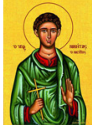
Άγιος Νικήτας ο Νισύριος