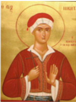
Άγιος Νικήτας ο Νισύριος