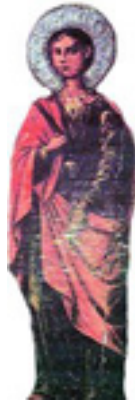
Άγιος Νικήτας ο Νισύριος