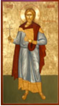
Άγιος Αλβανός πρωτομάρτυς Βρεταννίας