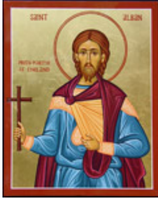
Άγιος Αλβανός πρωτομάρτυς Βρεταννίας