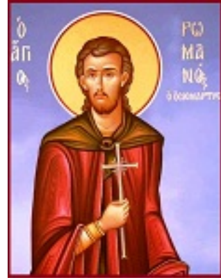
Άγιος Ρωμανός ο νέος Οσιομάρτυρας