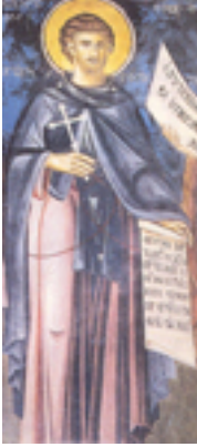
Άγιος Ρωμανός ο νέος Οσιομάρτυρας