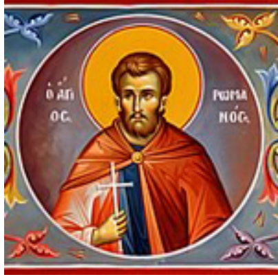
Άγιος Ρωμανός ο νέος Οσιομάρτυρας