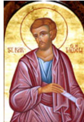
Άγιος Βαρθολομαίος ο Απόστολος