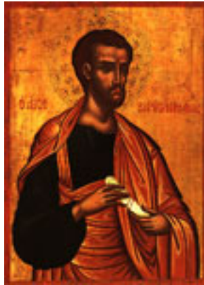
Άγιος Βαρθολομαίος ο Απόστολος