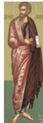
Άγιος Βαρθολομαίος ο Απόστολος