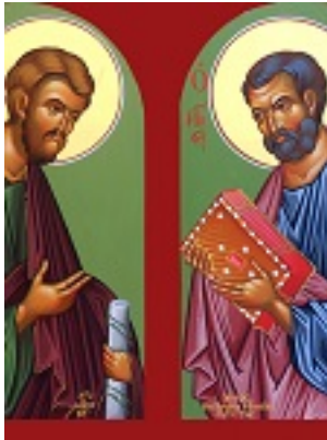
Άγιοι Βαρθολομαίος και Βαρνάβας - Μιχαήλ Χατζημιχαήλ© www.michaelhadjimichael.com