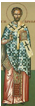
Άγιος Βαρθολομαίος ο Απόστολος