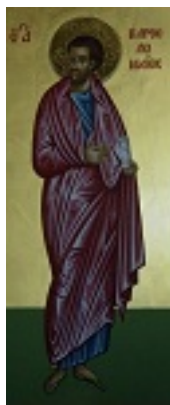
Άγιος Βαρθολομαίος ο Απόστολος