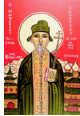
Άγιος Μητροφάνης Τσί-Σούνγκ