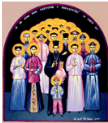
Άγιος Μητροφάνης Τσί-Σούνγκ και οι μαζί μ' αυτόν μαρτυρήσαντες: Τατιανή η Πρεσβυτέρα του, Ησαΐας και Ιωάννης οι γιοι του, Μαρία η νύφη του, Αγία Ία η διδασκάλισσα και άλλοι 222 Κινέζοι Μάρτυρες