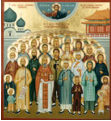
Άγιος Μητροφάνης Τσί-Σούνγκ και οι μαζί μ' αυτόν μαρτυρήσαντες: Τατιανή η Πρεσβυτέρα του, Ησαΐας και Ιωάννης οι γιοι του, Μαρία η νύφη του, Αγία Ία η διδασκάλισσα και άλλοι 222 Κινέζοι Μάρτυρες