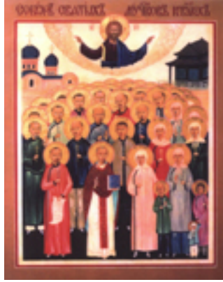
Άγιος Μητροφάνης Τσί-Σούνγκ και οι μαζί μ' αυτόν μαρτυρήσαντες: Τατιανή η Πρεσβυτέρα του, Ησαΐας και Ιωάννης οι γιοι του, Μαρία η νύφη του, Αγία Ία η διδασκάλισσα και άλλοι 222 Κινέζοι Μάρτυρες