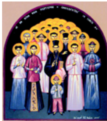
Άγιος Μητροφάνης Τσί-Σούνγκ και οι μαζί μ' αυτόν μαρτυρήσαντες: Τατιανή η Πρεσβυτέρα του, Ησαΐας και Ιωάννης οι γιοι του, Μαρία η νύφη του, Αγία Ία η διδασκάλισσα και άλλοι 222 Κινέζοι Μάρτυρες