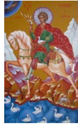
Άγιος Τρύφων ο Μάρτυρας - Μιχαήλ Χατζημιχαήλ© www.michaelhadjimichael.com