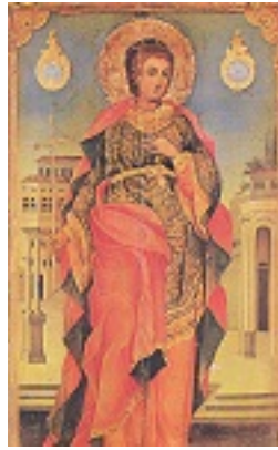
Άγιος Τρύφων ο Μάρτυρας