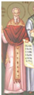
Άγιος Γλυκέριος ο Πρεσβύτερος