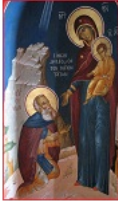
Όσιος Σίμων ο Μυροβλήτης