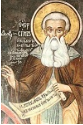
Όσιος Σίμων ο Μυροβλήτης