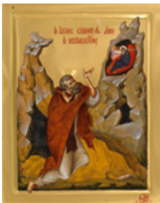
Όσιος Σίμων ο Μυροβλήτης - Εικόνα από το Αγιογραφείο της Μονής Βατοπαιδίου