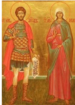
Άγιοι Αλέξανδρος και Αντωνίνα