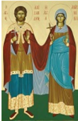
Άγιοι Αλέξανδρος και Αντωνίνα