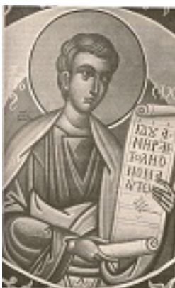
Προφήτης Ζαχαρίας - Φώτης Κόντογλου