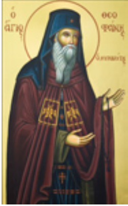
Όσιος Θεοφάνης ο Μυροβλύτης