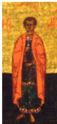
Άγιος Θεόδωτος ο εν Άγκυρα