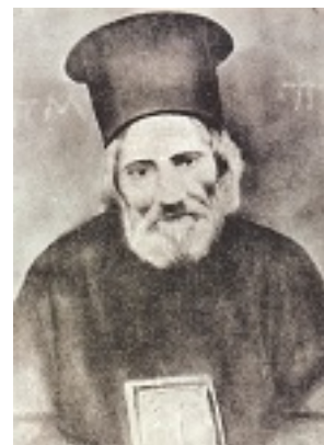
Όσιος Παναγής Μπασιάς (Παΐσιος)