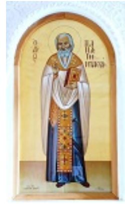
Όσιος Παναγής Μπασιάς (Παΐσιος)