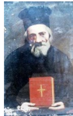
Όσιος Παναγής Μπασιάς (Παΐσιος)