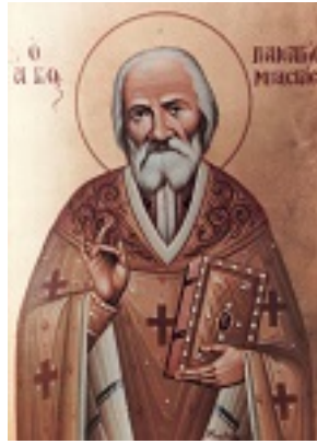
Όσιος Παναγής Μπασιάς (Παΐσιος)