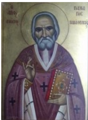
Όσιος Παναγής Μπασιάς (Παΐσιος)