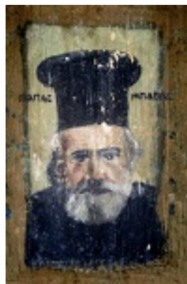
Όσιος Παναγής Μπασιάς (Παΐσιος)