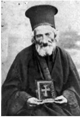
Όσιος Παναγής Μπασιάς (Παΐσιος)