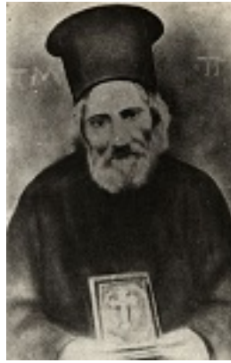
Όσιος Παναγής Μπασιάς (Παΐσιος)