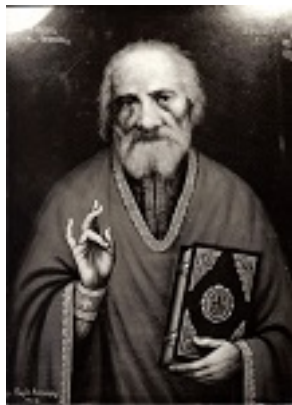
Όσιος Παναγής Μπασιάς (Παΐσιος)