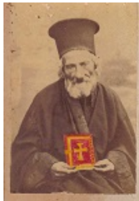
Όσιος Παναγής Μπασιάς (Παΐσιος)