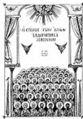
Σύναξη των Αγίων Εβδομήκοντα Αποστόλων