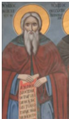
Όσιος Θεόκτιστος ηγούμενος Κουκουμίου