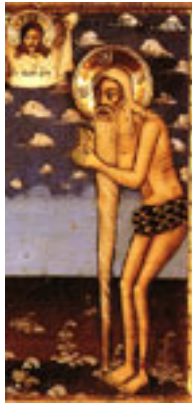
Όσιος Πέτρος ο Θεοφόρος ο εν Άθω ασκήσας