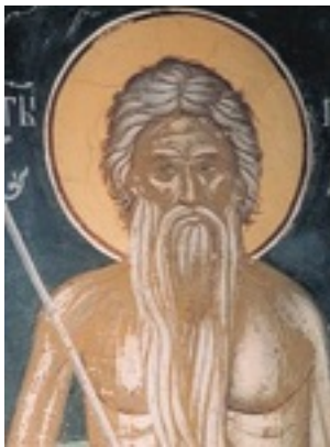
Όσιος Πέτρος ο Θεοφόρος ο εν Άθω ασκήσας