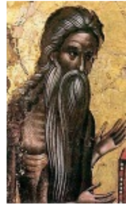
Όσιος Πέτρος ο Θεοφόρος ο εν Άθω ασκήσας