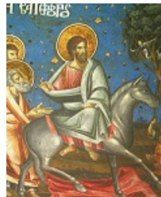
Κυριακή των Βαΐων - Τοιχογραφία στο Κυριακό της Σκήτης Καυσοκαλυβίων. 18ος αιώνας μ.Χ.