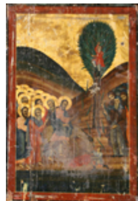
Κυριακή των Βαΐων - Ι.Ν. Ζωοδόχου Πηγής, Λαρίσης ( www.panagialarisis.gr )