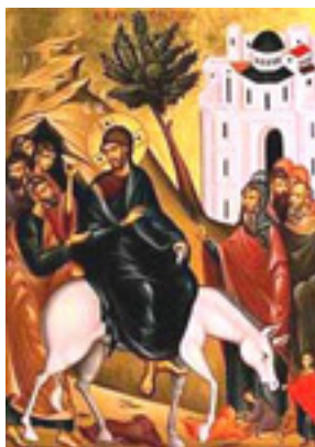
Κυριακή των Βαΐων