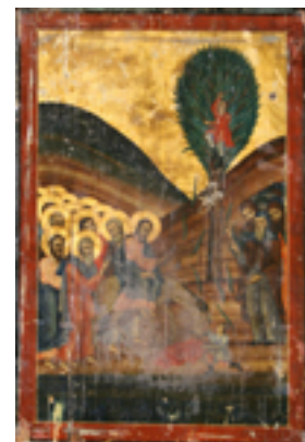
Κυριακή των Βαΐων - Ι.Ν. Ζωοδόχου Πηγής, Λαρίσης