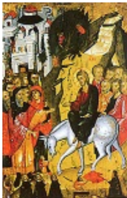
Κυριακή των Βαΐων