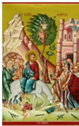
Κυριακή των Βαΐων