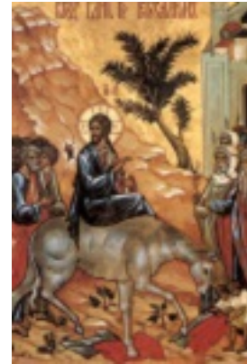
Κυριακή των Βαΐων