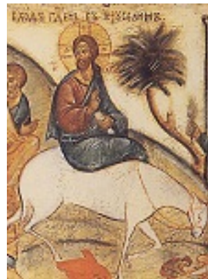
Κυριακή των Βαΐων