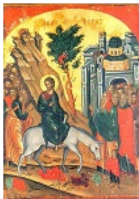
Κυριακή των Βαΐων - 1546 μ.Χ. - Μονή Σταυρονικήτα, Άγιον Όρος (Κρητική σχολή, Θεοφάνης ο Κρής)