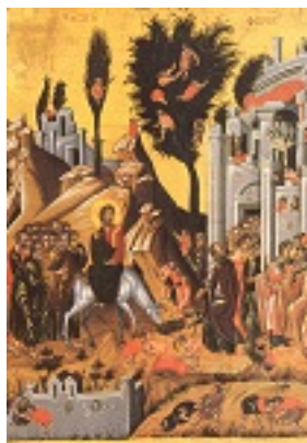
Κυριακή των Βαΐων