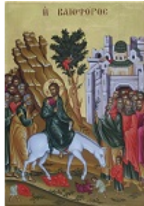
Κυριακή των Βαΐων