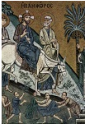
Κυριακή των Βαΐων