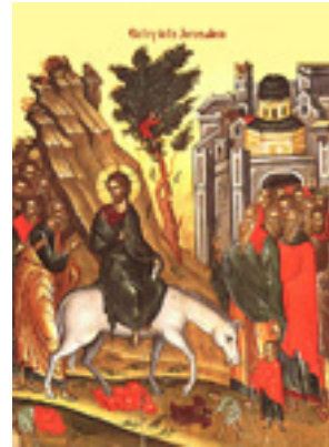
Κυριακή των Βαΐων