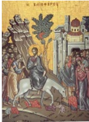
Κυριακή των Βαΐων