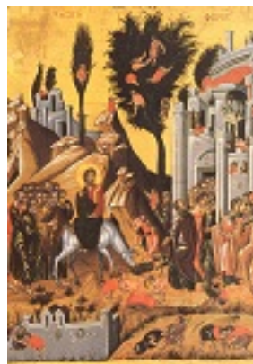
Κυριακή των Βαΐων