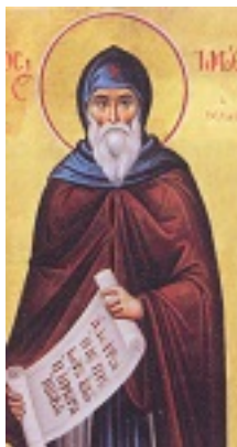
Άγιος Τιμόθεος ο νέος Οσιομάρτυρας που μαρτύρησε στη Θεσσαλονίκη