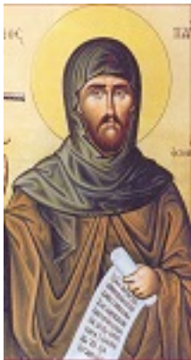
Άγιος Παύλος ο νέος Οσιομάρτυρας από τα Ιωάννινα