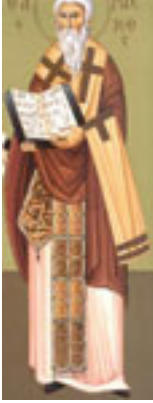
Όσιος Έρασμος ο Ιερομάρτυρας