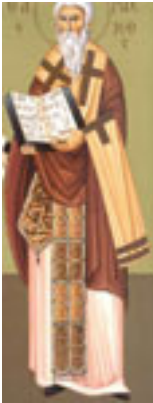
Όσιος Έρασμος ο Ιερομάρτυρας