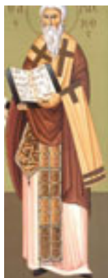
Όσιος Έρασμος ο Ιερομάρτυρας