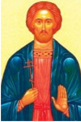
Άγιος Ιωάννης ο Τραπεζούντιος ο εν Ασπροκάστρω αθλήσας, ο Νεομάρτυρας