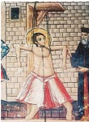
Άγιος Κωνσταντίνος ο εξ Αγαρηνών