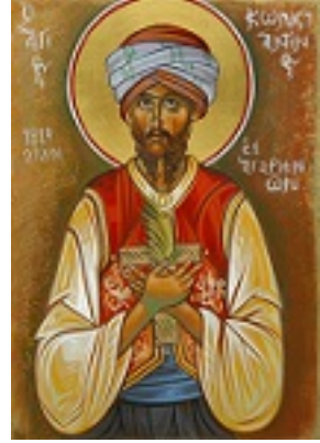
Άγιος Κωνσταντίνος ο εξ Αγαρηνών