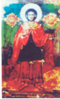
Άγιος Κωνσταντίνος ο εξ Αγαρηνών