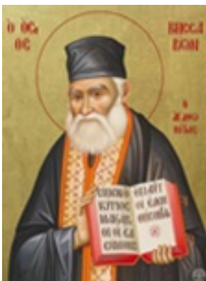
Όσιος Βησσαρίων Κορκολιάκος, ο Αγαθωνίτης