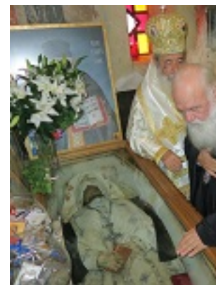
Όσιος Βησσαρίων Κορκολιάκος, ο Αγαθωνίτης