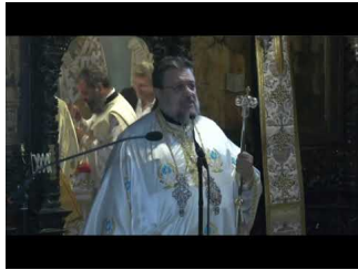
Πολυαρχιερατικό συλλείτουργο στην Ι.Μ. Αγάθωνος με αφορμή την αγιοκατάταξη του γέροντα Βησσαρίωνα