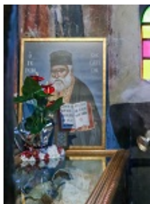
Όσιος Βησσαρίων Κορκολιάκος, ο Αγαθωνίτης