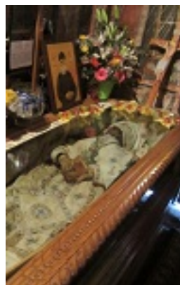
Όσιος Βησσαρίων Κορκολιάκος, ο Αγαθωνίτης