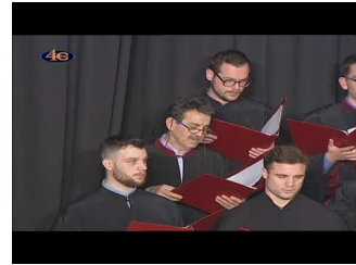
Επικαιροτητες Παρουσίαση Βιβλίου "Βησσαρίων ο Αγαθωνίτης, ο Ελεήμων Πνευματικός"