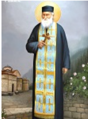
Όσιος Βησσαρίων Κορκολιάκος, ο Αγαθωνίτης