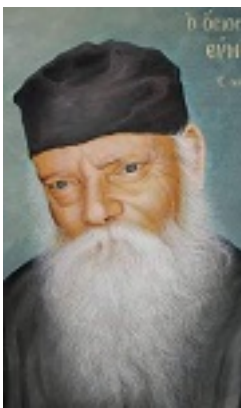
Ὅσιος Ευμένιος ο νέος ο Θεοφόρος (Σαριδάκης)