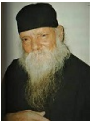
Όσιος Ευμένιος ο νέος ο Θεοφόρος (Σαριδάκης)