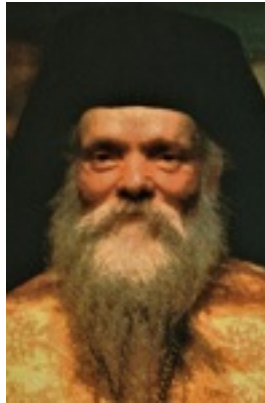
Όσιος Ευμένιος ο νέος ο Θεοφόρος (Σαριδάκης)