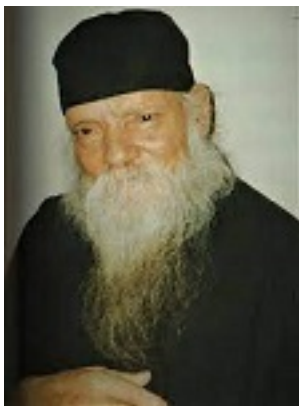
Όσιος Ευμένιος ο νέος ο Θεοφόρος (Σαριδάκης)