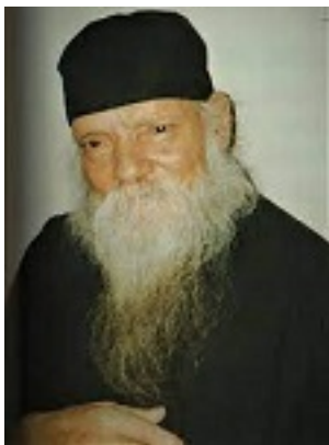
Όσιος Ευμένιος ο νέος ο Θεοφόρος (Σαριδάκης)