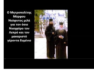
Ο Μητροπολίτης Μόρφου Νεόφυτος μιλά για τούς όσιους Νικηφόρο τού Λεπρού και τόν μακαριστό γέροντα Ευμένιο Ο όσιος Άνθιμος της Χίου, ο όσιος Νικηφόρος ο Λεπρός και ο Γέροντας Ευμένιος ο Λεπρός