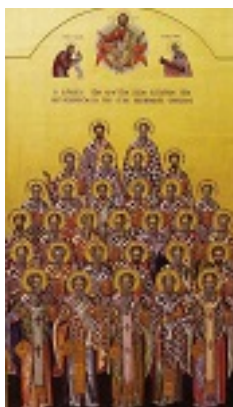
Σύναξη των Αγίων Κρητών Πατέρων των Οικουμενικών Συνόδων