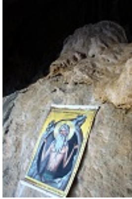
Όσιος Κοσμάς ο ερημίτης και ομολογητής (Αββακόσπηλιο)