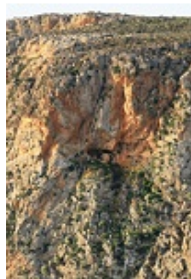
Η σπηλιά της άσκησης της Οσίας Κασσιανής