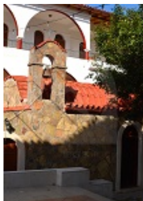
Ο Ιερός Ναός Οσίων και Οσιομαρτύρων Παναγίας Καλυβιανής