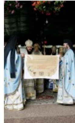
Άγιος Γεώργιος ο Προσκυνητής