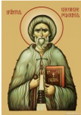
Άγιος Γεώργιος ο Προσκυνητής