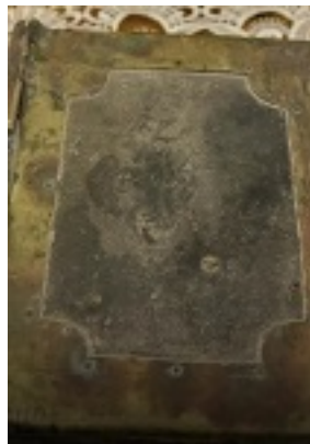
Άγιος Γεώργιος ο Προσκυνητής