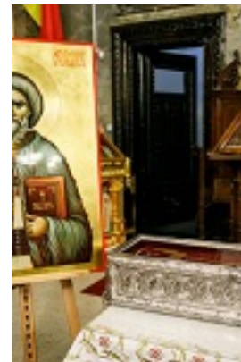
Άγιος Γεώργιος ο Προσκυνητής