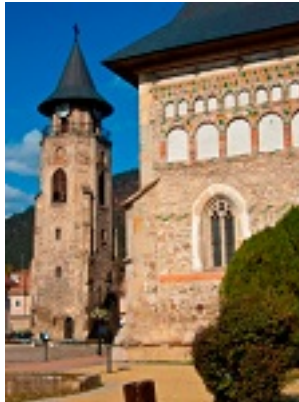
Το κωδωνοστάσιο του Ι.Ν.Αγ.Στεφάνου όπου έζησε για 26 χρόνια ο Άγ.Γεώργιος ο Προσκυνητής