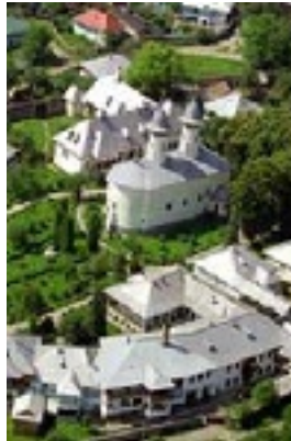
Η Μονή Βαράτεκ