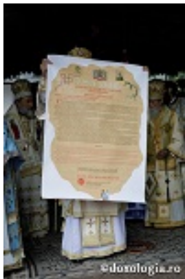
Άγιος Γεώργιος ο Προσκυνητής