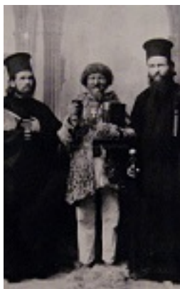
Άγιος Γεώργιος ο Προσκυνητής