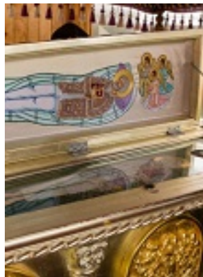
Άγιος Γεώργιος ο Προσκυνητής