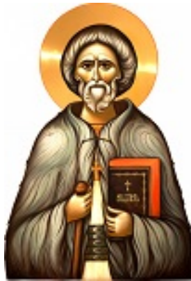
Άγιος Γεώργιος ο Προσκυνητής