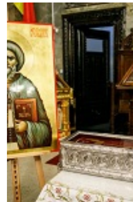
Άγιος Γεώργιος ο Προσκυνητής