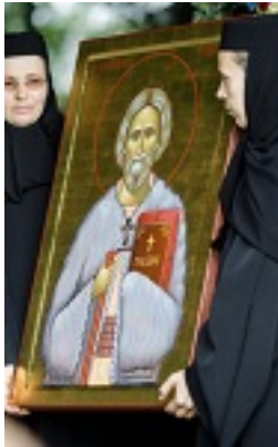
Άγιος Γεώργιος ο Προσκυνητής