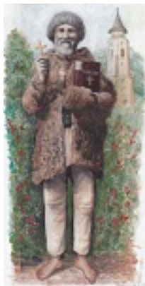
Άγιος Γεώργιος ο Προσκυνητής