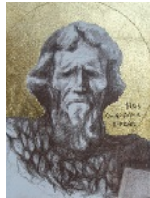
Άγιος Γεώργιος ο Προσκυνητής