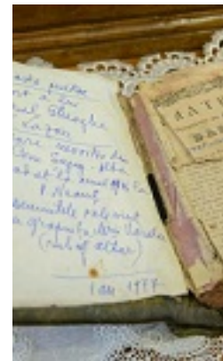
Άγιος Γεώργιος ο Προσκυνητής