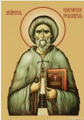
Άγιος Γεώργιος ο Προσκυνητής