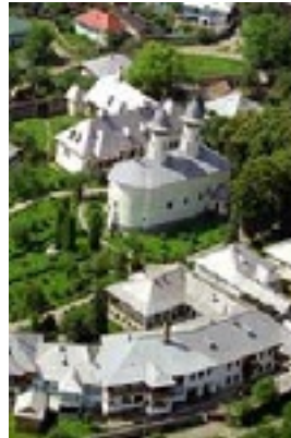
Η Μονή Βαράτεκ