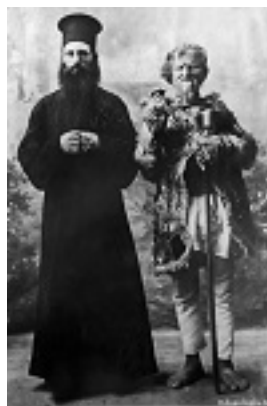
Άγιος Γεώργιος ο Προσκυνητής