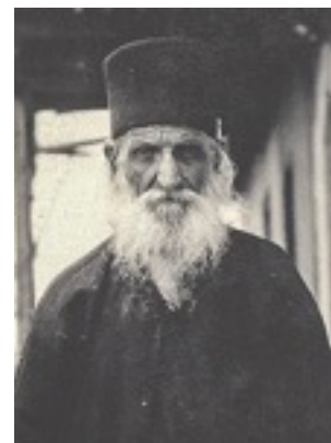
Όσιος Δανιήλ ο Κατουνακιώτης (Φωτογραφία: Νικόλας Κάλας, Άνοιξη 1929. Πηγή: Φωτογραφικό Αρχείο Ε.Λ.Ι.Α.)