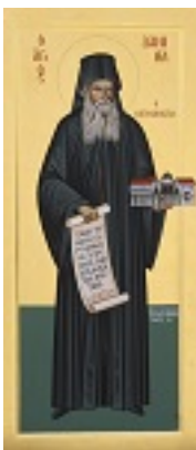
Όσιος Δανιήλ ο Κατουνακιώτης