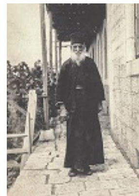
Όσιος Δανιήλ ο Κατουνακιώτης (Φωτογραφία: Νικόλας Κάλας, Άνοιξη 1929. Πηγή: Φωτογραφικό Αρχείο Ε.Λ.Ι.Α.)