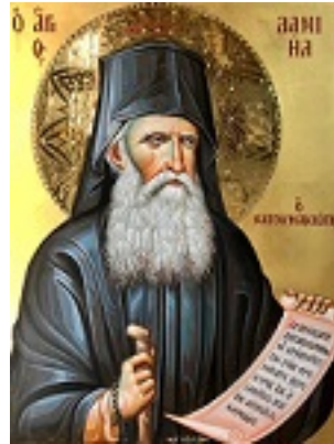
Όσιος Δανιήλ ο Κατουνακιώτης