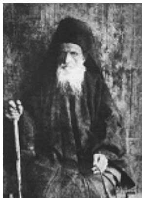
Όσιος Δανιήλ ο Κατουνακιώτης