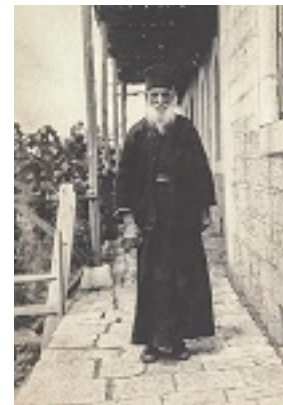
Όσιος Δανιήλ ο Κατουνακιώτης (Φωτογραφία: Νικόλας Κάλας, Άνοιξη 1929. Πηγή: Φωτογραφικό Αρχείο Ε.Λ.Ι.Α.)