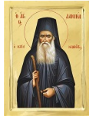
Όσιος Δανιήλ ο Κατουνακιώτης