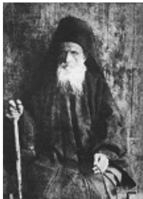
Όσιος Δανιήλ ο Κατουνακιώτης