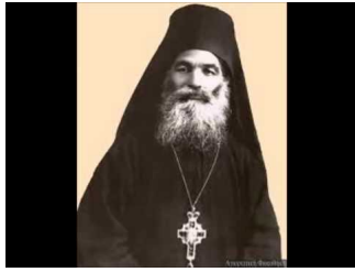
Ο Γέροντας Ιερώνυμος Α' μέρος - Ιερομόναχος Μύρων Σιμωνοπετρίτης