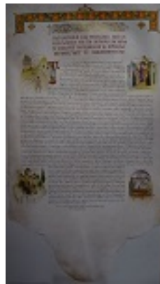
Η Πατριαρχική πράξη για την αγιοκατάταξη του Οσίου Ιερωνύμου