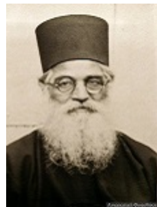
Όσιος Ιερώνυμος ο Σιμωνοπετρίτης Όσιος Ιερώνυμος ο Σιμωνοπετρίτης Όσιος Ιερώνυμος ο Σιμωνοπετρίτης