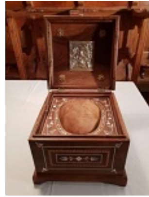
Η τιμία κάρα του Οσίου Ιερώνυμου του Σιμωνοπετρίτη