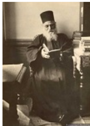
Όσιος Ιερώνυμος ο Σιμωνοπετρίτης Όσιος Ιερώνυμος ο Σιμωνοπετρίτης Όσιος Ιερώνυμος ο Σιμωνοπετρίτης