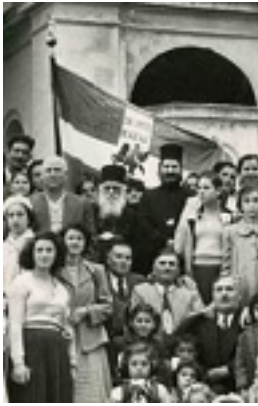
Όσιος Ιερώνυμος ο Σιμωνοπετρίτης