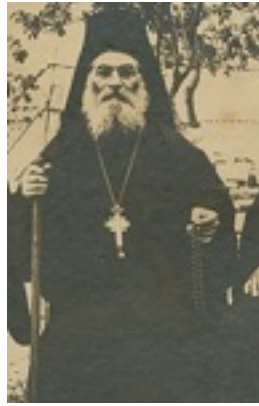
Όσιος Ιερώνυμος ο Σιμωνοπετρίτης