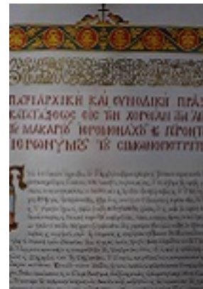
Τμήμα της Πατριαρχικής πράξης για την αγιοκατάταξη του Οσίου Ιερωνύμου