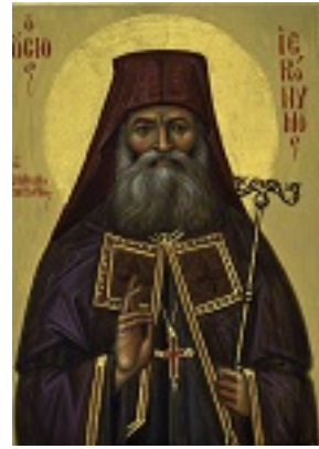
Όσιος Ιερώνυμος ο Σιμωνοπετρίτης Όσιος Ιερώνυμος ο Σιμωνοπετρίτης Όσιος Ιερώνυμος ο Σιμωνοπετρίτης - Τοιχογραφία στον Ιερό Ναό της Αναλήψεως