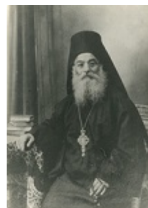
Όσιος Ιερώνυμος ο Σιμωνοπετρίτης Όσιος Ιερώνυμος ο Σιμωνοπετρίτης Όσιος Ιερώνυμος ο Σιμωνοπετρίτης