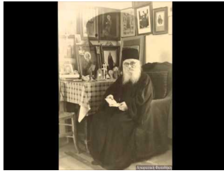
Ο Γέροντας Ιερώνυμος Β' μέρος - Ομιλία Μύρωνος Ιερομονάχου