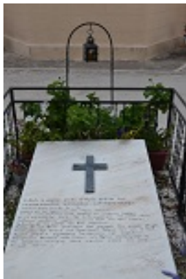
Ο τάφος του Οσίου Ιερωνύμου