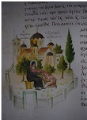
Τμήμα της Πατριαρχικής πράξης για την αγιοκατάταξη του Οσίου Ιερωνύμου