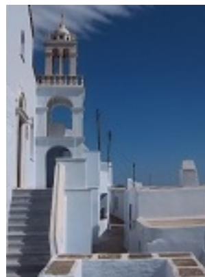
Σύναξη της Παναγίας Κυρίας των Αγγέλων στην Τήνο