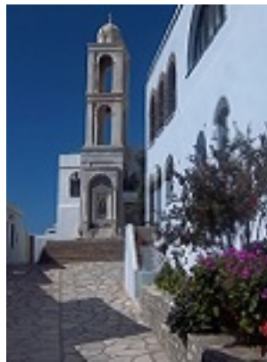
Σύναξη της Παναγίας Κυρίας των Αγγέλων στην Τήνο