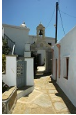
Σύναξη της Παναγίας Κυρίας των Αγγέλων στην Τήνο