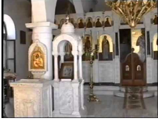
Ιερα Μονη Κοιμησεως Θεοτοκου Κεχροβουνιου/Αγ Πελαγια-Τηνος- Κυκλαδες