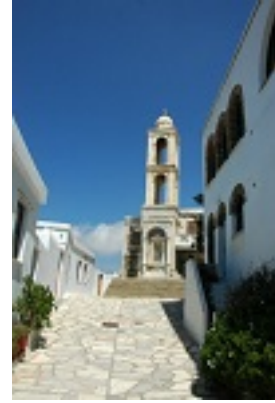
Σύναξη της Παναγίας Κυρίας των Αγγέλων στην Τήνο