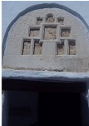
Σύναξη της Παναγίας Κυρίας των Αγγέλων στην Τήνο - Το κελί της Οσίας Πελαγίας