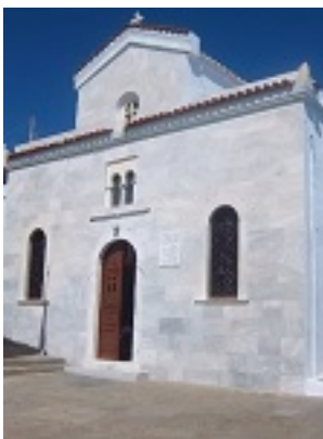
Σύναξη της Παναγίας Κυρίας των Αγγέλων στην Τήνο