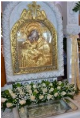
Σύναξη της Παναγίας Κυρίας των Αγγέλων στην Τήνο - Η κάρα της Οσίας Πελαγίας