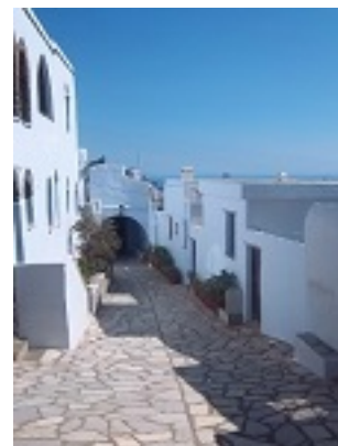
Σύναξη της Παναγίας Κυρίας των Αγγέλων στην Τήνο