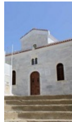
Σύναξη της Παναγίας Κυρίας των Αγγέλων στην Τήνο