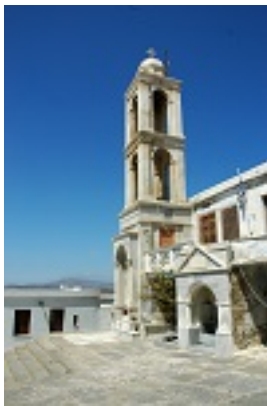
Σύναξη της Παναγίας Κυρίας των Αγγέλων στην Τήνο