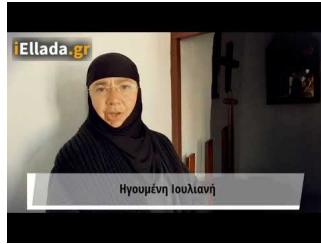
Το iellada στην Τήνο: Εδώ η Αγία Πελαγία οραματίστηκε την εικόνα της Παναγίας