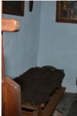
Σύναξη της Παναγίας Κυρίας των Αγγέλων στην Τήνο - Το κελί της Οσίας Πελαγίας