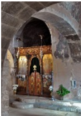
Σύναξη της Παναγίας Καρδιώτισσας (Κεράς)