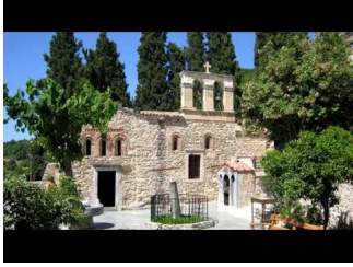
Μονή Κεράς Καρδιωτίσσης