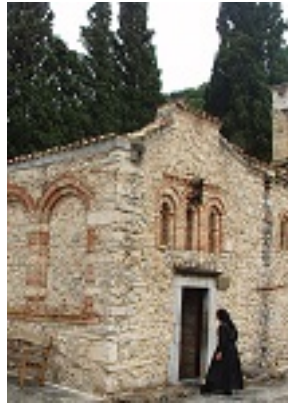
Σύναξη της Παναγίας Καρδιώτισσας (Κεράς)