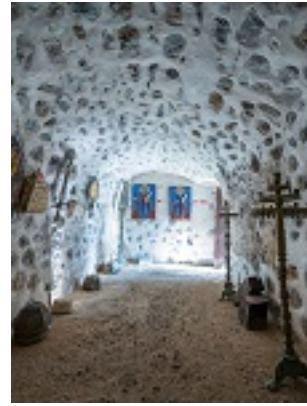
Σύναξη της Παναγίας Καρδιώτισσας (Κεράς)