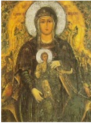
Σύναξη της Παναγίας Καρδιώτισσας (Κεράς)