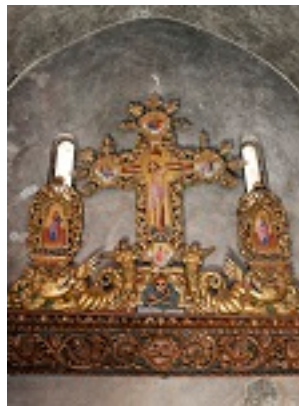
Σύναξη της Παναγίας Καρδιώτισσας (Κεράς)