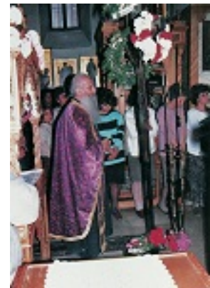
Όσιος Ιάκωβος (Τσαλίκης), ο Θεοφόρος, καθηγούμενος της Ιεράς Μονής Οσίου Δαυΐδ του εν Ευβοία