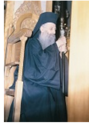
Όσιος Ιάκωβος (Τσαλίκης), ο Θεοφόρος, καθηγούμενος της Ιεράς Μονής Οσίου Δαυΐδ του εν Ευβοία