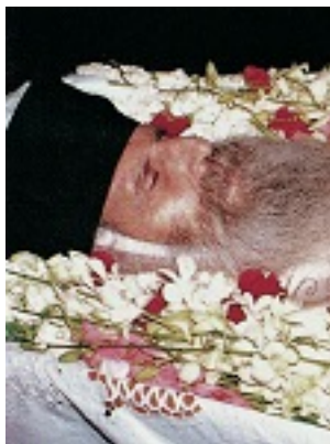
Όσιος Ιάκωβος (Τσαλίκης), ο Θεοφόρος, καθηγούμενος της Ιεράς Μονής Οσίου Δαυΐδ του εν Ευβοία