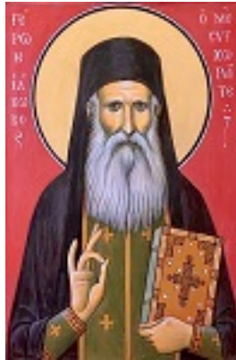
Όσιος Ιάκωβος (Τσαλίκης), ο Θεοφόρος, καθηγούμενος της Ιεράς Μονής Οσίου Δαυΐδ του εν Ευβοία