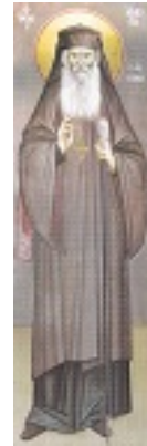
Όσιος Ιάκωβος (Τσαλίκης), ο Θεοφόρος, καθηγούμενος της Ιεράς Μονής Οσίου Δαυΐδ του εν Ευβοία