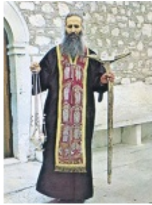
Όσιος Ιάκωβος (Τσαλίκης), ο Θεοφόρος, καθηγούμενος της Ιεράς Μονής Οσίου Δαυΐδ του εν Ευβοία