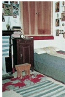
Όσιος Ιάκωβος (Τσαλίκης), ο Θεοφόρος, καθηγούμενος της Ιεράς Μονής Οσίου Δαυΐδ του εν Ευβοία