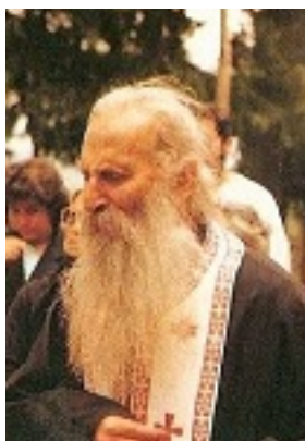
Όσιος Ιάκωβος (Τσαλίκης), ο Θεοφόρος, καθηγούμενος της Ιεράς Μονής Οσίου Δαυΐδ του εν Ευβοία