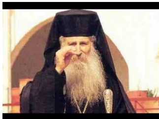
"Πώς να ψάξεις να βρεις καλό πνευματικό..." Αγ. ΙΑΚΩΒΟΣ ΤΣΑΛΙΚΗΣ - (ΒΙΝΤΕΟ)