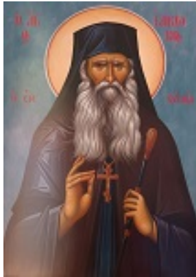
Όσιος Ιάκωβος (Τσαλίκης), ο Θεοφόρος, καθηγούμενος της Ιεράς Μονής Οσίου Δαυΐδ του εν Ευβοία