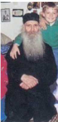
Όσιος Ιάκωβος (Τσαλίκης), ο Θεοφόρος, καθηγούμενος της Ιεράς Μονής Οσίου Δαυΐδ του εν Ευβοία