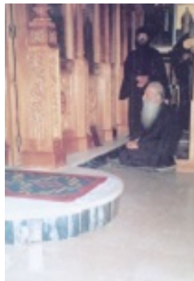
Όσιος Ιάκωβος (Τσαλίκης), ο Θεοφόρος, καθηγούμενος της Ιεράς Μονής Οσίου Δαυΐδ του εν Ευβοία