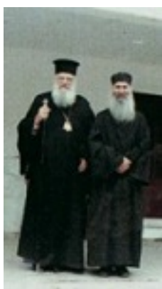
Όσιος Ιάκωβος (Τσαλίκης), ο Θεοφόρος, καθηγούμενος της Ιεράς Μονής Οσίου Δαυΐδ του εν Ευβοία