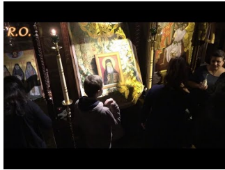
Πρώτη Άγρυπνία προς τιμήν τοῦ Ὁσίου Γέροντος Ἰακώβου Τσαλίκη 17-18 Νοεμβρίου 2017