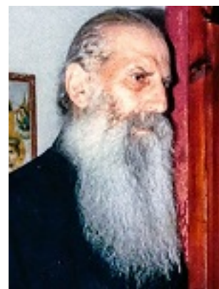
Όσιος Ιάκωβος (Τσαλίκης), ο Θεοφόρος, καθηγούμενος της Ιεράς Μονής Οσίου Δαυΐδ του εν Ευβοία