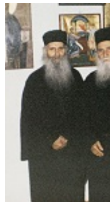
Όσιος Ιάκωβος (Τσαλίκης), ο Θεοφόρος, καθηγούμενος της Ιεράς Μονής Οσίου Δαυΐδ του εν Ευβοία