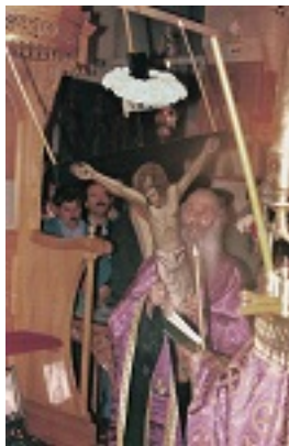
Όσιος Ιάκωβος (Τσαλίκης), ο Θεοφόρος, καθηγούμενος της Ιεράς Μονής Οσίου Δαυΐδ του εν Ευβοία