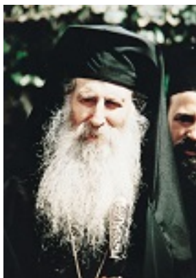
Όσιος Ιάκωβος (Τσαλίκης), ο Θεοφόρος, καθηγούμενος της Ιεράς Μονής Οσίου Δαυΐδ του εν Ευβοία