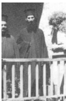
Όσιος Ιάκωβος (Τσαλίκης), ο Θεοφόρος, καθηγούμενος της Ιεράς Μονής Οσίου Δαυΐδ του εν Ευβοία