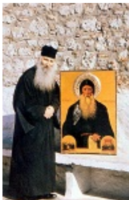
Όσιος Ιάκωβος (Τσαλίκης), ο Θεοφόρος, καθηγούμενος της Ιεράς Μονής Οσίου Δαυΐδ του εν Ευβοία