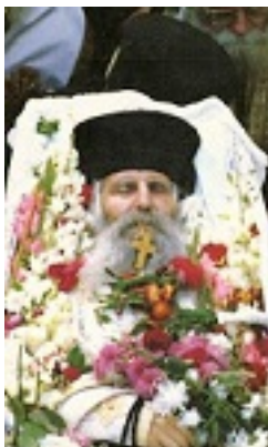
Όσιος Ιάκωβος (Τσαλίκης), ο Θεοφόρος, κατηγούμενος της Ιεράς Μονής Οσίου Δαυΐδ του εν Ευβοία