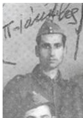
Όσιος Ιάκωβος (Τσαλίκης), ο Θεοφόρος, καθηγούμενος της Ιεράς Μονής Οσίου Δαυΐδ του εν Ευβοία