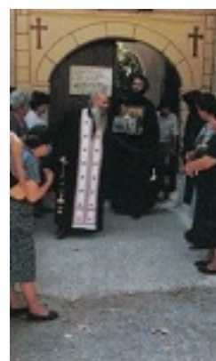
Όσιος Ιάκωβος (Τσαλίκης), ο Θεοφόρος, καθηγούμενος της Ιεράς Μονής Οσίου Δαυΐδ του εν Ευβοία