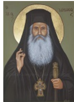
Όσιος Ιάκωβος (Τσαλίκης), ο Θεοφόρος, καθηγούμενος της Ιεράς Μονής Οσίου Δαυΐδ του εν Ευβοία - Λυδία Γουριώτη© ( http://lydiagourioti- iconography.blogspot.com )