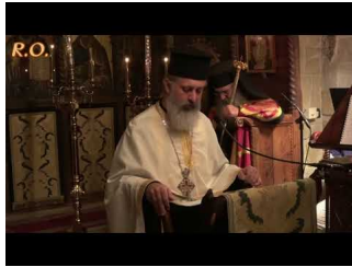
Μητροπολίτου Μόρφου Νεοφύτου: "Σύντομος Βίος τοῦ Ὁσίου Γέροντος Ἰακώβου Τσαλίκη"