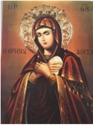
Σύναξη της Παναγίας Θρηνωδούσας στην Νέα Όλυνθο Χαλκιδικής