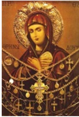
Σύναξη της Παναγίας Θρηνωδούσας στην Νέα Όλυνθο Χαλκιδικής