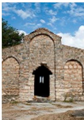
Παναγία Ζερβιώτισσα, Χανιά Κρήτη