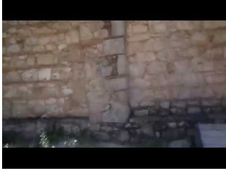
Παναγία Ζερβιώτισσα - Στύλος Αποκορώνου