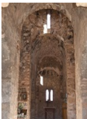
Παναγία Ζερβιώτισσα, Χανιά Κρήτη