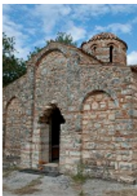
Παναγία Ζερβιώτισσα, Χανιά Κρήτη