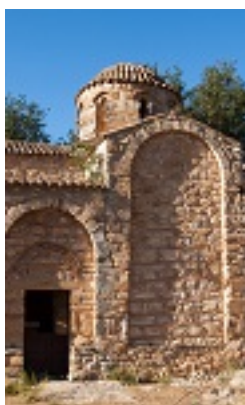
Παναγία Ζερβιώτισσα, Χανιά Κρήτη