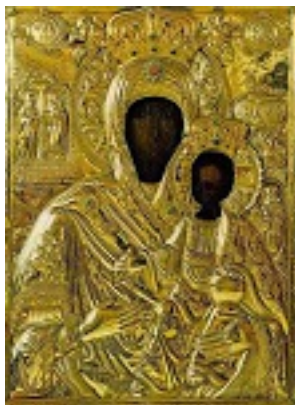
Σύναξη της Παναγίας της Κουκουζέλισσας στο Άγιον Όρος