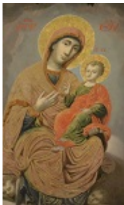
Σύναξη της Παναγίας Ταυριώτισσας στον Ιερό Ναό του Αγίου Γεωργίου Ταύρου