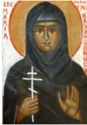
Αγία Μαρία Σκόμπτσοβα