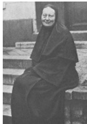
Αγία Μαρία Σκόμπτσοβα