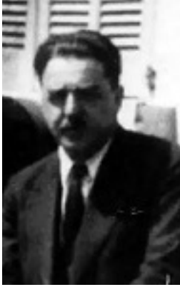
Άγιος Ηλίας Φονταμίνσκυ