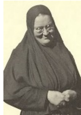
Αγία Μαρία Σκόμπτσοβα