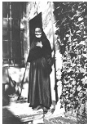
Αγία Μαρία Σκόμπτσοβα