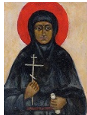
Αγία Μαρία Σκόμπτσοβα