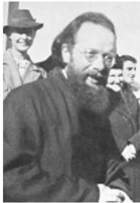
Άγιος Δημήτριος Κλεπινίν