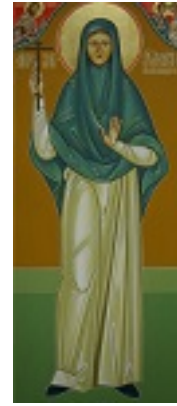
Αγία Μαρία Σκόμπτσοβα