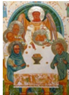
Σύναξη των Ρώσων αγίων των εν Γαλλία τελειωθέντων