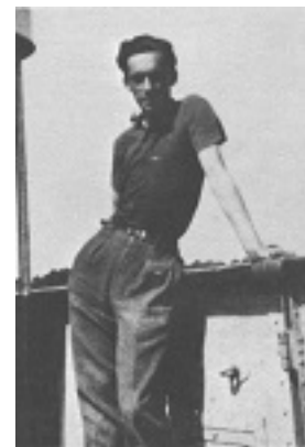
Άγιος Γιούρι Σκόμπτσωφ