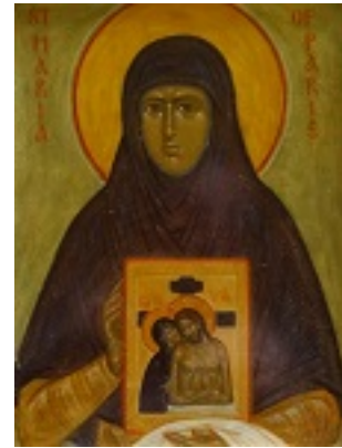
Αγία Μαρία Σκόμπτσοβα