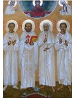
Σύναξη των Ρώσων αγίων των εν Γαλλία τελειωθέντων