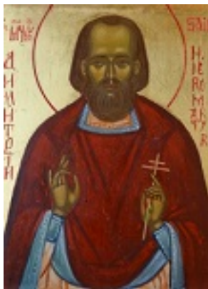
Άγιος Δημήτριος Κλεπινίν