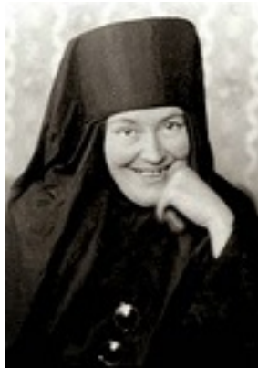
Αγία Μαρία Σκόμπτσοβα