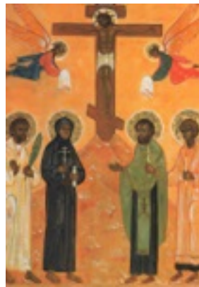
Σύναξη των Ρώσων αγίων των εν Γαλλία τελειωθέντων