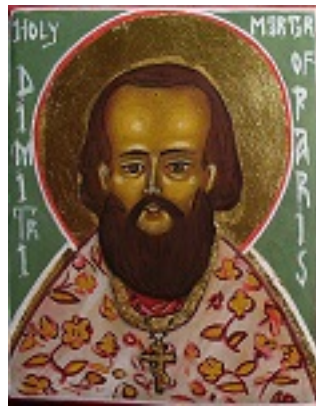
Άγιος Δημήτριος Κλεπινίν