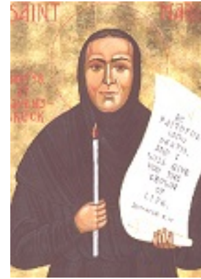
Αγία Μαρία Σκόμπτσοβα