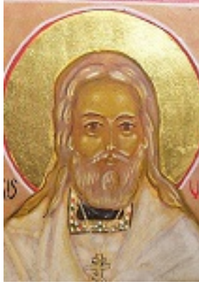
Άγιος Αλέξιος Medvedkov