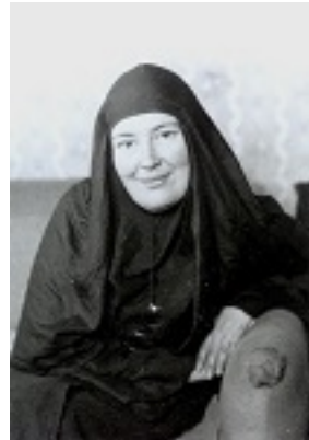
Αγία Μαρία Σκόμπτσοβα