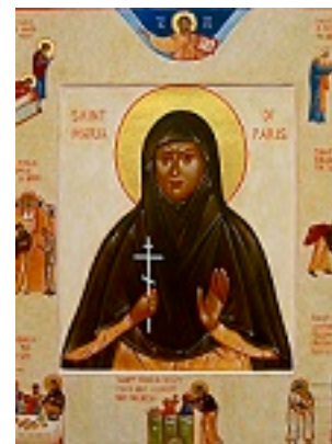
Αγία Μαρία Σκόμπτσοβα