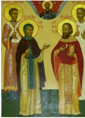
Σύναξη των Ρώσων αγίων των εν Γαλλία τελειωθέντων