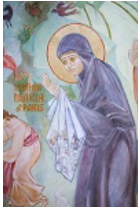
Αγία Μαρία Σκόμπτσοβα