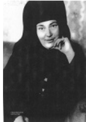
Αγία Μαρία Σκόμπτσοβα