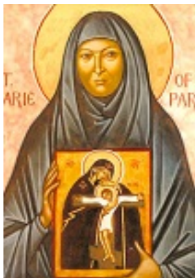
Αγία Μαρία Σκόμπτσοβα