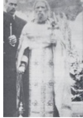
Άγιος Αλέξιος Medvedkov