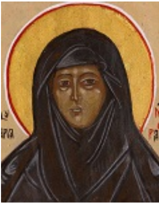
Αγία Μαρία Σκόμπτσοβα