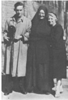
Άγιοι Μαρία Σκόμπτσοβα και Γιούρι Σκόμπτσωφ