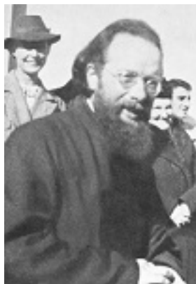
Άγιος Δημήτριος Κλεπινίν