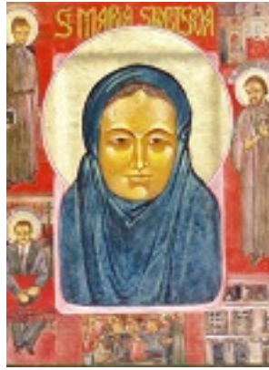
Σύναξη των Ρώσων αγίων των εν Γαλλία τελειωθέντων