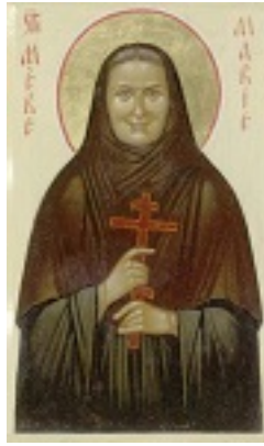
Αγία Μαρία Σκόμπτσοβα