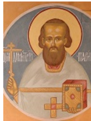
Άγιος Δημήτριος Κλεπινίν