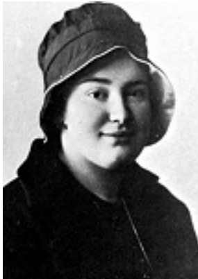
Αγία Μαρία Σκόμπτσοβα