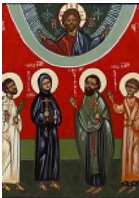
Σύναξη των Ρώσων αγίων των εν Γαλλία τελειωθέντων