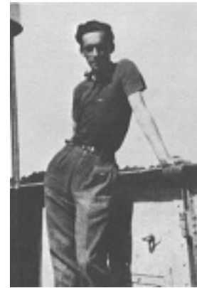
Άγιος Γιούρι Σκόμπτσωφ