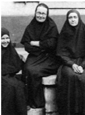
Αγία Μαρία Σκόμπτσοβα