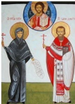
Άγιοι Μαρία Σκόμπτσοβα και Δημήτριος Κλεπινίν