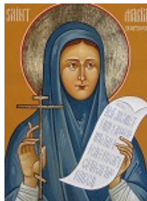
Αγία Μαρία Σκόμπτσοβα