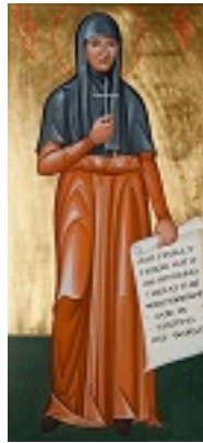
Αγία Μαρία Σκόμπτσοβα