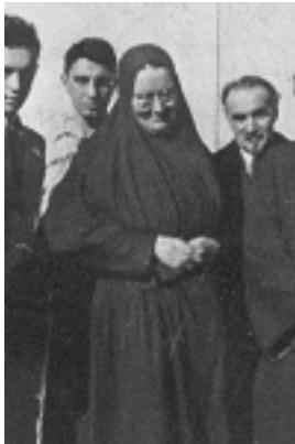
Άγια Μαρία Σκόμπτσοβα