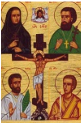
Σύναξη των Ρώσων αγίων των εν Γαλλία τελειωθέντων