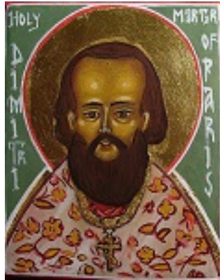
Άγιος Δημήτριος Κλεπινίν