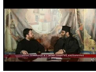
Ιερά Μονή Παναγίας Κασσωπίτρας (γ)