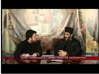
Ιερά Μονή Παναγίας Κασσωπίτρας (δ)