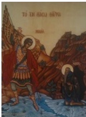
Ανάμνηση θαύματος Αρχαγγέλου Μιχαήλ και εύρεση του Τιμίου Ἴλου