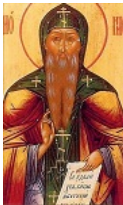
Όσιος Διονύσιος του Γλουσέτσκ ο Θαυματουργός