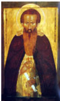
Όσιος Διονύσιος του Γλουσέτσκ ο Θαυματουργός