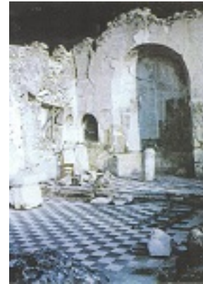
Η παλαιά Ιερά Μονή των Αγίων Φανέντων Σάμης υπέστη μεγάλες καταστροφές στους καταστροφικούς σεισμούς του 1953 μ.Χ. που έπληξαν το νησί της Κεφαλληνίας