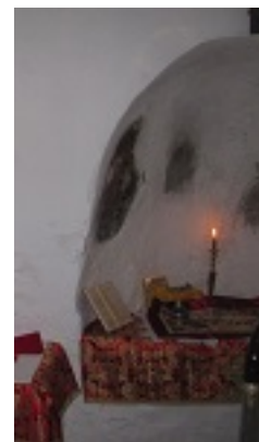
Η κόγχη του ιερού του Ναού της Οσίας με σπαράγματα τοιχογραφιών