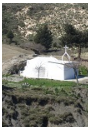
Το εκκλησάκι της Οσίας Μελούς από τα ανατολικά, τη θέση Κοκκινόερο