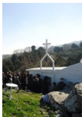
Ο Ναός της Οσίας Μελούς και το πλήθος των προσκυνητών στις 26 Μαρτίου 2011 μ.Χ. από το σημείο που βρίσκονται τα ερείπια του κελλιού του μοναχού που αναφέρει ο Ιάκωβος Ζαρράφτης