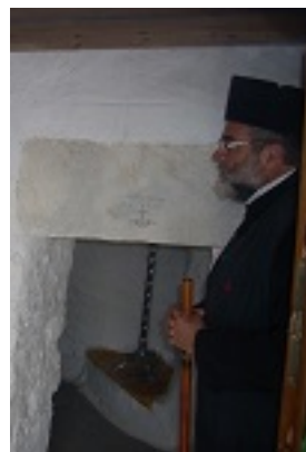
Ο Σεβασμιώτατος Μητροπολίτης Κώου και Νισύρου κ. Ναθαναήλ δίπλα σε αγιογραφία της Οσίας και την επιγραφή του Ναού