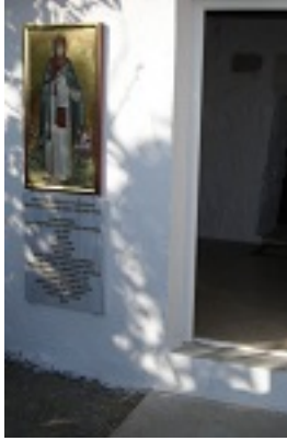
Ο Ναός της Οσίας Μελούς