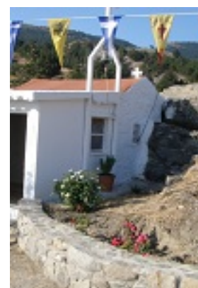
Ο Ναός της Οσίας Μελούς