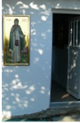
Ο Ναός της Οσίας Μελούς