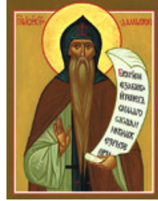
Όσιος Ισαάκιος ο Ομολογητής ηγούμενος Μονής Δαλμάτων