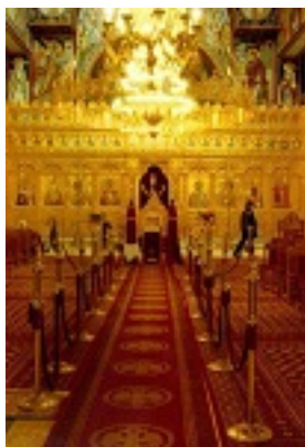
Παναγία Ελευθερώτρια Διδυμοτείχου