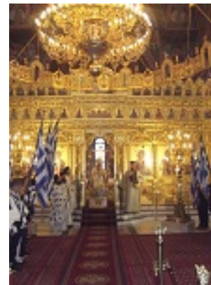
Παναγία Ελευθερώτρια Διδυμοτείχου