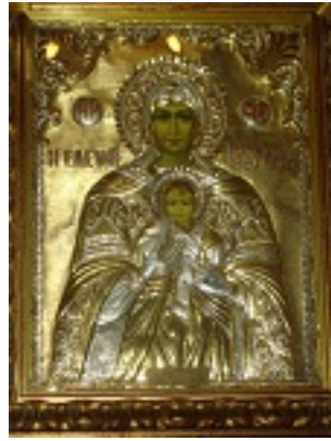
Παναγία Ελευθερώτρια Διδυμοτείχου