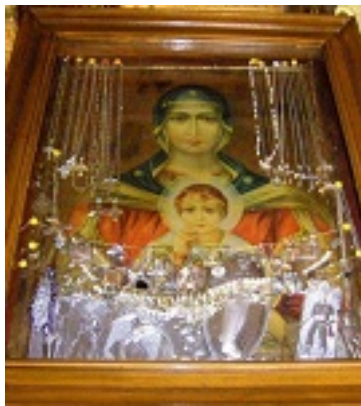
Παναγία Ελευθερώτρια Διδυμοτείχου