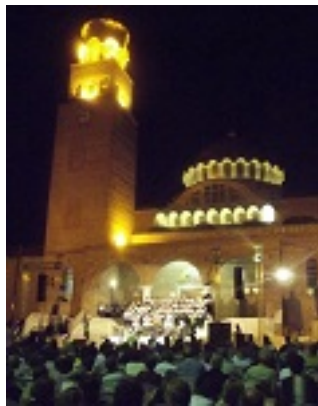
Παναγία Ελευθερώτρια Διδυμοτείχου