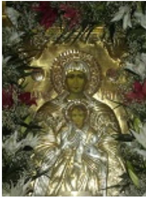
Παναγία Ελευθερώτρια Διδυμοτείχου